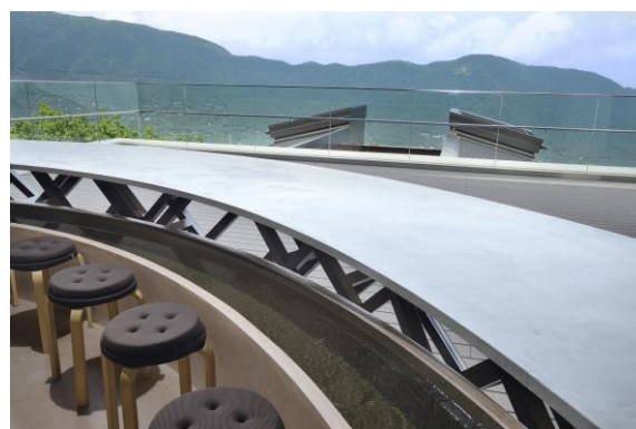
足湯から望む景色