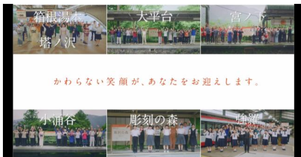
プロモーション動画「ワクワクが、帰ってきた。」一部抜粋

箱根登山電車全線運転再開プロモーション動画「ワクワクが、帰ってきた。」の詳細は下記のとおりです。