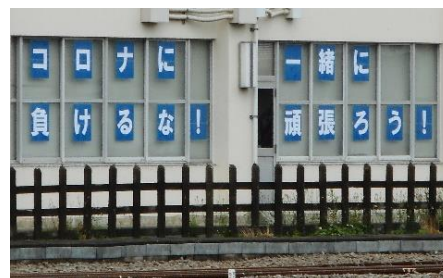
乗務員事務所の窓に掲出したメッセージ（相模大野）