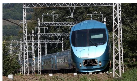
特別列車「Thank you ロマンスカー」 に使用する 特急ロマンスカー・MSE（60000形）

当社ではこれまでも、新型コロナウイルスに打ち勝つためのメッセージを車窓から見える乗務員事務所窓へ掲出するほか、駅構内に医療従事者へ向けたメッセージボードを設置するなど、さまざまなメッセージを発信してまいりました。今回の「Thank you プロジェクト」はその一環として実施するものです。