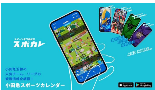
小田急スポカレ ポスター（イメージ）

当社では、中長期戦略においてスポーツをコンテンツに沿線活性化を目指す、スポーツ共創戦略「OSEC100 - Bound For Fun-」を掲げ、さまざまなパートナーとの連携により、誰もがスポーツの魅力に触れ、楽しんでいただける環境づくりに取り組んでいます。「小田急スポカレ」を通じて、より多くの方に観戦等のきっかけとなり、小田急沿線での生活を楽しんでいただきたいと思います。