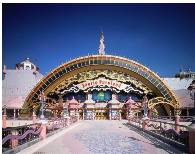
サンリオピューロランド 外観

EMotは、日々の行動の利便性をより高め、新しい生活スタイルや観光の楽しみ方を提案するMaaSアプリで、現在は「複合経路検索」と「電子チケットの発行」の2つの機能を備えています。今般の電子チケットラインナップの拡充により、さらに幅広いお出かけにお役立ていただけるアプリとしてアップデートします。