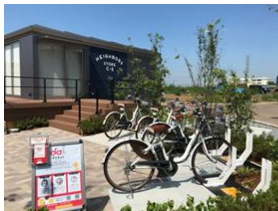
ステーションイメージ