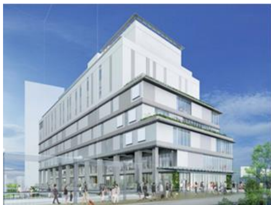
海老名駅自由通路から見た外観イメージ

さらに、「VINA GARDENS」を中心とした健康増進、さらには海老名市域全体の活性化を目的に、2020年10月22日（木）、出店する3者と海老名市、当社の間で、5者包括連携協定「健康増進事業等に係る連携と協力に関する協定」を締結しました。今後、“ウェルネス”をキーワードとした連携施策の実現に向けた検討を進めてまいります。