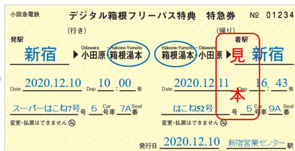
「デジタル箱根フリーパス（特付）」 （イメージ）