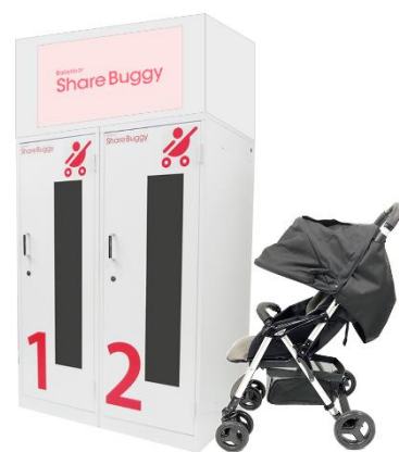
「専用ポート」イメージ

今回、需要や清掃方法に関して実証し、本展開に向けた課題を確認します。Babydoor 株式会社提供のベビーカーシェアリング事業”Share Buggy”を活用することで「安心」「便利」「快適」にご利用いただけるサービスの提供を目指します。