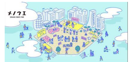
メノウエプロジェクトポスター

2021年1月にスタートしたプロジェクトです。新宿西口スバルビル跡地「SHINJUKU ODAKYU PARK」で「感性」をテーマにパートナーを集い、五感に訴えながらの体験を通じてエリアの活性化、ひいては新宿西口の未来を考えていきます。