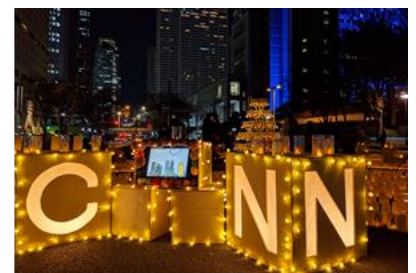
2020年開催当日の様子

特に、2020年は、リアルでもオンラインでもお楽しみいただけるイベントとして、また一般財団法人公園財団と株式会社スクウェア・エニックスと連携し、体験型ナイトウォークが楽しめるイベント「SHINJUKU HIKARI 2020」の一環として実施しました。