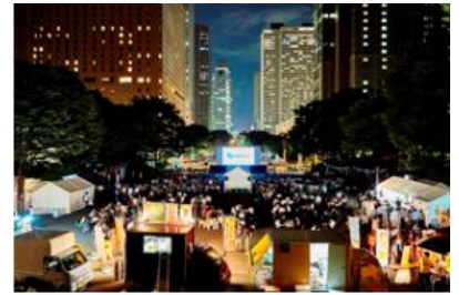
2019年開催当日の様子