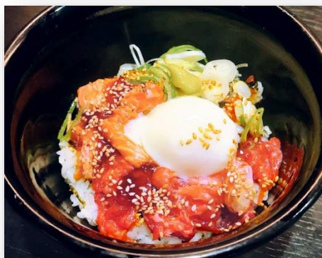
鮭の鬼かまどろ丼 850円(税込)

希少部位の炙りかまどろとトロけるすき身を温泉卵で一つにまとめた一品。出汁醤油のジュレで堪能でき、ロコデリでしか味わえません。価格もロコデリ限定価格です。