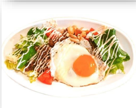
タコライス 750円(税込)

フジテレビのノンストップ!で紹介された人気商品。厳選した豚バラ肉を大分県産のこだわりの醤油でじっくりと煮込みました。旨味が凝縮された一品です。