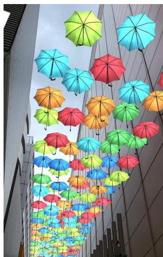
アート&空間らくがき