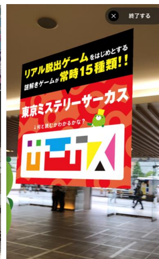
広告・クーポン配信