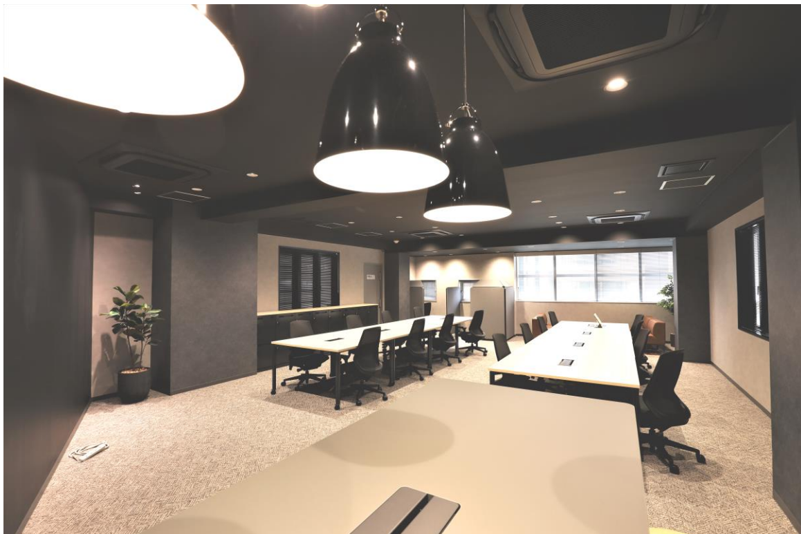
セットアップオフィス内観

セットアップオフィスは、あらかじめ内装を仕上げ、オフィス家具を設えることで、入居者さまがスピーディーに事業を開始できることや移転等による労力・コスト双方の負担を軽減できるメリットがあり、企業のステップアップを応援するフレキシブルなオフィスです。