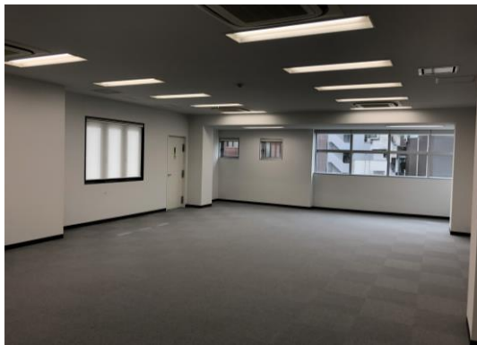
通常のオフィスを借りる場合

「ファイブアネックス」が存する渋谷・恵比寿エリアは、クリエイティブな感性や新たなカルチャーが生まれる場所として、多くのIT企業やベンチャー企業・ベンチャーキャピタル等が集まっており、そのような企業の事業スピード・ニーズに応える商品を開発しました。