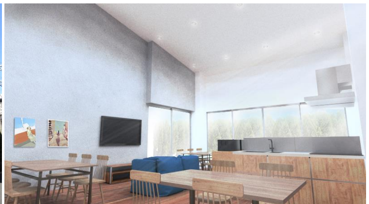
「ファンネ経堂」 （左）外観 （右）内部イメージ