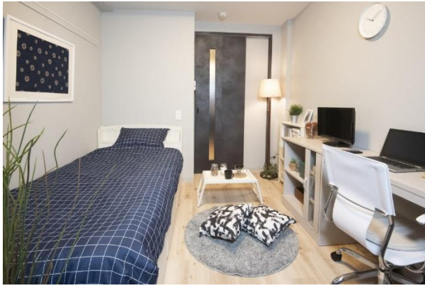
< 居室 >