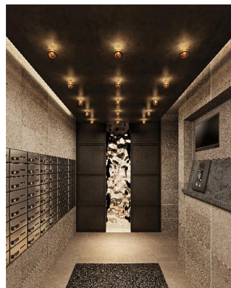
&lt; エントランス &gt;