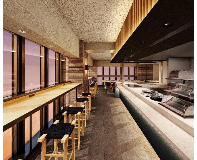
< 食堂 >