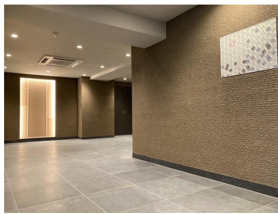
<エントランスホール>