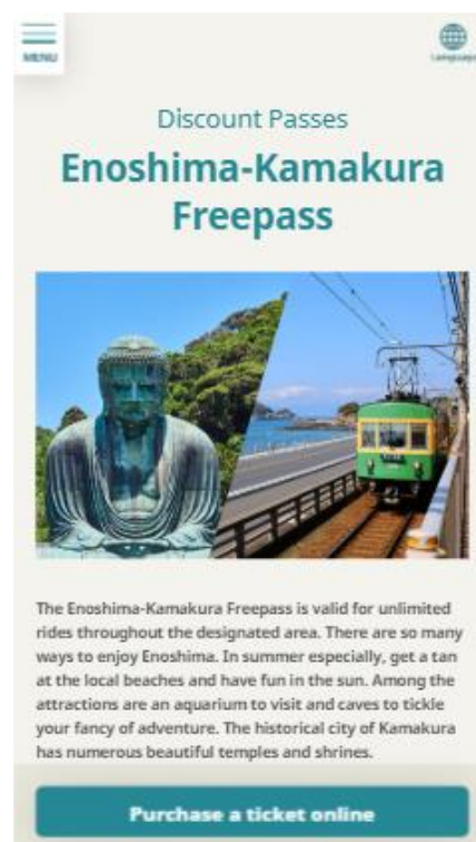
「江の島・鎌倉フリーパス」紹介ページ（イメージ）