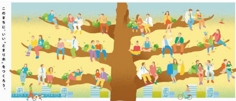
「ViNA GARDENS PERCH」キービジュアル

さらに、今年の夏、8階の一部には最新オペにも対応可能な「海老名駅前眼科」や、明るく清潔で居心地のよい「献血ルーム」が開業する予定です。なお、本施設8階から10階には今夏、市内最大級のフィットネスクラブ、3階から5階には秋以降にバラエティー豊かな商業や生活を充実させるサービスの開業を予定しています。