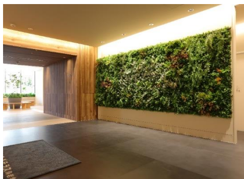
7階健診センター・クリニック