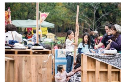
ウッドパレットを使用した遊び (イメージ)

今年1月にオープンした「NANSEI PLUS」では、広場を利用した初めてのイベントを開催します。天然の木でつくられた多様なサイズのウッドパレットを組み立て秘密基地をつくらったり、ウッドパレットを黒板に見立てお絵描きを体験いただくなど、子どもたちの自由な発想と自主性を促す遊びをご用意しています。「NANSEI PLUS」は開業以来、お子さまをお連れの方のご利用が増えており、全体の完成に向けてさらなる地域の日常生活への貢献を目指します。