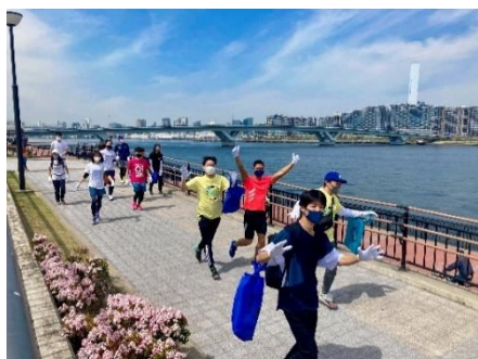
プロギング（イメージ）

当社では、2021年9月、サーキュラーエコノミー（循環型経済）の実現に重要な役割を果たす資源・廃棄物の収集運搬を最適化し、そこから生まれた余力をごみの削減やリサイクルなどの資源循環の拡充へと繋げるウェイストマネジメント事業「WOOMS（ウームス）」をスタートしています。本イベントは、「WOOMS」が資源循環につなげることを目的に企画・提供するアクティベーションを活用し、楽しみながら環境問題を身近に感じていただきたいという想いから実施します。今後は沿線内外への拡大を視野に、環境問題に関心を持っていただける方を増やし、“ごみ”のない持続可能な循環型社会の形成を目指します。