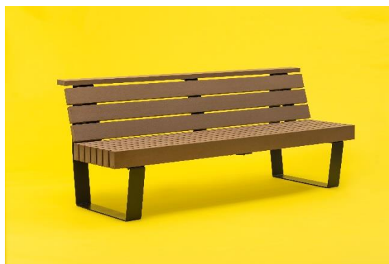
設置ベンチ（Fandaline） 写真提供：フクビ化学工業株式会社

座間駅周辺では、座間市と連携し、駅前の屋外空間を活用した緑の広場の整備や、人と街をつなぐ駅前団地「ホシノタニ団地」を拠点とした地域イベント「ホシノタニマーケット」を実施するなど、市内活性化に取り組んでいます。グランドレベルは、「ホシノタニ団地」におけるコミュニティ拠点「喫茶ランドリーホシノタニ団地」を運営しており、座間駅周辺でのまちづくりに協働しています。