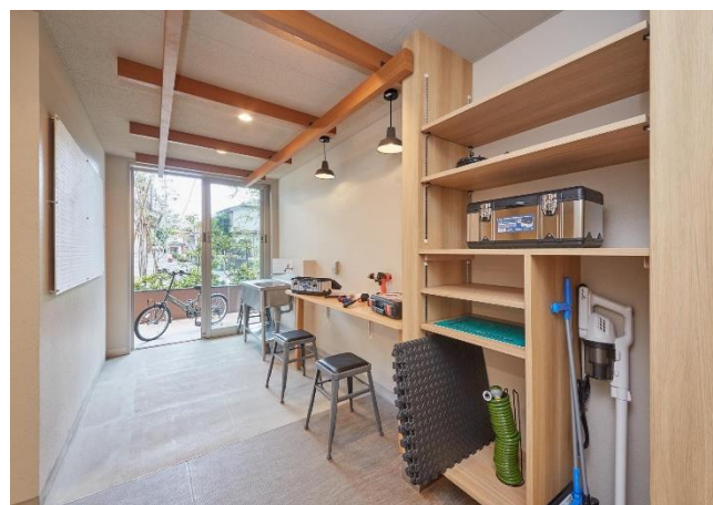
リーフィアレジデンス古淵 「みんなのDIY工房」写真