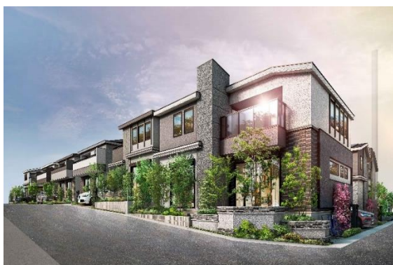
<リーフィア新百合ヶ丘グレイスコート>

【リーフィアブランドサイト】 https://www.odakyu-leafia.jp/brand/