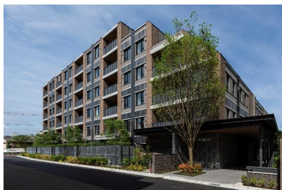
<リーフィアレジデンス調布小島町>