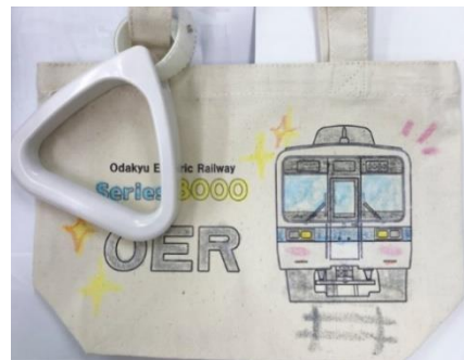
ワークショップ制作商品 オリジナルトートバッグ