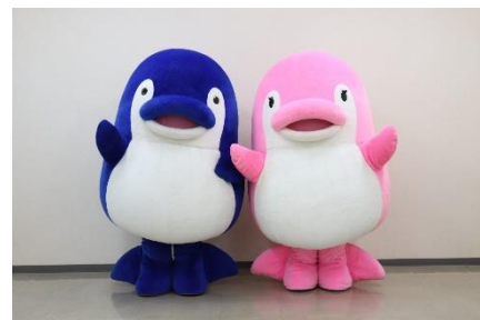
ことでんマスコットキャラクター