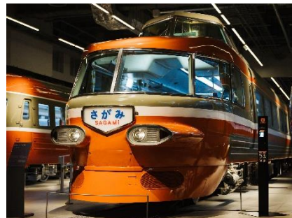
ロマンスカー・NSE（3100 形）