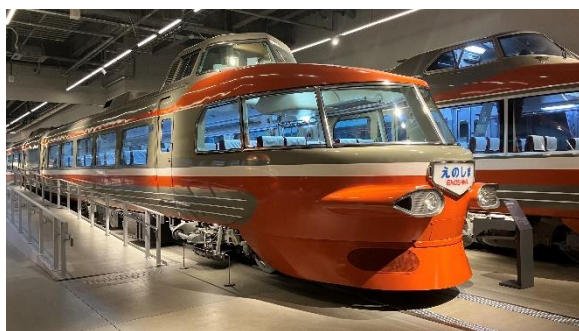
「鉄道の日」に、内部を特別開放する ロマンスカー・NSE (3100 形)

小田急電鉄株式会社が運営するロマンスカーミュージアム（所在地：神奈川県海老名市 館長：吉久 治朗）は、2024年10月9日（水）から11月18日（月）まで、鉄道の日（10月14日）を記念したイベント「Romancecar Reborn」を実施します。日常生活を支える鉄道事業において、車両や部品のリユースが、いかに環境負荷低減や、観光資源となり地域活性化に貢献しているかをクローズアップし、鉄道の新たな魅力として発見いただけるものです。