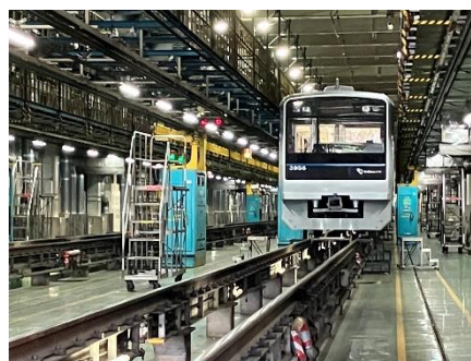
整備士目線で車両の床下を 見学いただける検査用線路（イメージ）

期間中の常設企画「『小田急電鉄の譲渡車両』パネル展示」では、本イベント名にちなみ、小田急線を走ってきた2種のロマンスカーが、長野電鉄と富士急行に譲渡した後、編成数やカラーリングを変更しながら、両社路線で現役運行している様子をご覧ください。このほか、通勤車両 8000 形を西武鉄道に、空調装置等の部品を高松琴平電気鉄道に、それぞれ環境負荷低減などの観点から、譲渡した例を紹介します。また、「鉄道の日」当日は、普段立ち入りをご遠慮いただいているロマンスカー・NSE(3100 形)の展望席や喫茶カウンターを開放し、レアな写真撮影などをお楽しみいただけます。