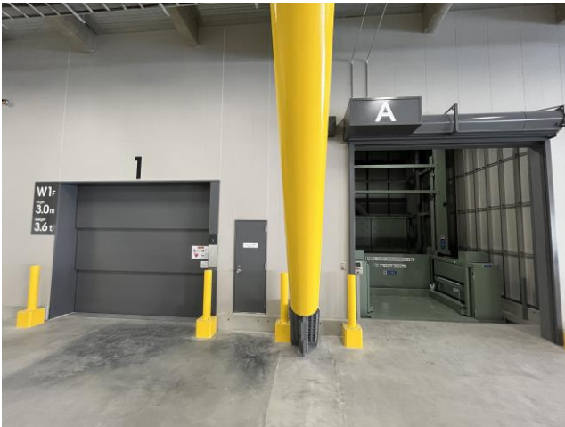
<荷物用EV・垂直搬送機>