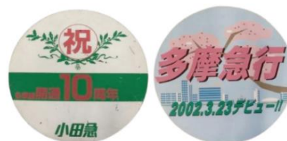
実際に使用したヘッドマーク（イメージ）

街の発展や多摩線の開業から今日までの歴史を紹介します。年代別の多摩の風景写真、開業当時のダイアグラムや実際に車両に掲出したヘッドマークなどを展示します。多摩の沿線写真や資料を比較して、多摩の移り変わりをとお楽しみいただけます。