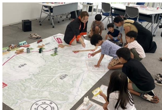
「多摩線づくり」ワークショップ（イメージ）

期間を通して行う目玉企画は、多摩線と多摩線沿線の今昔を振り返る企画展です。開業に向けて線路敷設する様子に加え、開業当時の駅や列車が走行する様子、沿線の街並みなどをパネルにしており、記憶に思いを馳せたり、懐かしい思い出をお子さまやお孫さまと共有してお楽しみいただけます。また、時代ごとのダイヤグラムを展示しており、多摩の街の発展とともに、運行本数が増加していく様子をご覧いただけるほか、多摩線開業時に発売した「多摩線開通記念切符」や 2002 年の多摩急行デビュー時に車両へ実際に掲出したヘッドマークを展示します。