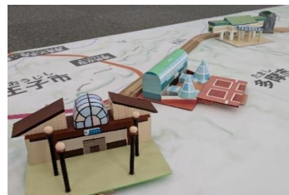
ワークショップ（イメージ）

大きな地図上に駅と線路の模型を配置して、多摩線を再現する小学生向けのワークショップです。地理の知識と一緒に、多摩線の特長を学んでいただけます。