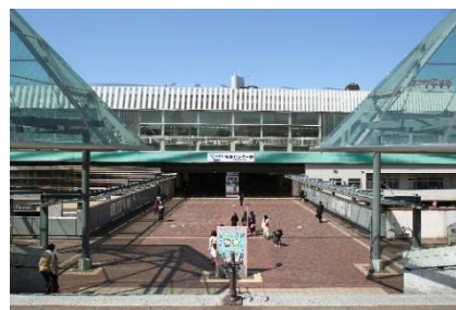
小田急多摩センター駅