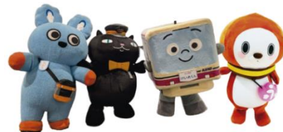
キャラクターグリーティング（イメージ）

2025年1月11日（土）に、多摩センター駅に乗り入れる3社がコラボレーションし、イベントを開催します。各社の駅長によるトークショーやキャラクターのグリーティング、多摩の特産品販売などを行います。