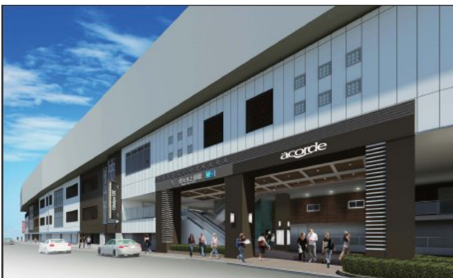
アコルデ代々木上原 外観(イメージ)