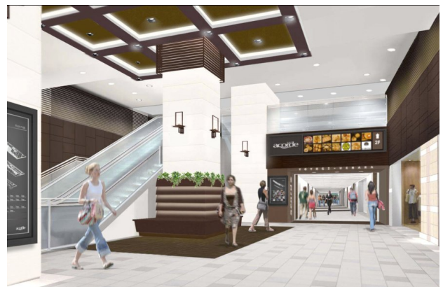
新設エスカレーターと吹き抜け(イメージ)