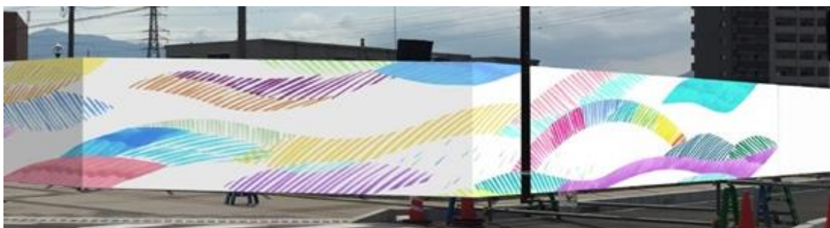
仮囲いアート「 ももいろ 百色の空」 2016年10月下旬～（イメージ）