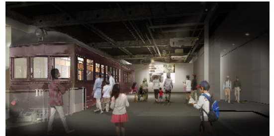
歴史シアター（イメージ）

小田急線開業当時の車両であるモハ1の展示や、当社やロマンスカーの歴史を凝縮したショートムービーを放映します。