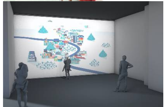
上・下 キッズロマンスカーパーク (イメージ)