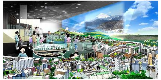
ジオラマパーク (イメージ)

また、ジオラマの背景はすべてスクリーンとなっており、ジオラマ上の列車の動きにあわせて映像やライティングなどの演出が楽しめることも特徴です。さらに、ジオラマを上から俯瞰できるデッキ「ジオラマビューテラス」も設置します。