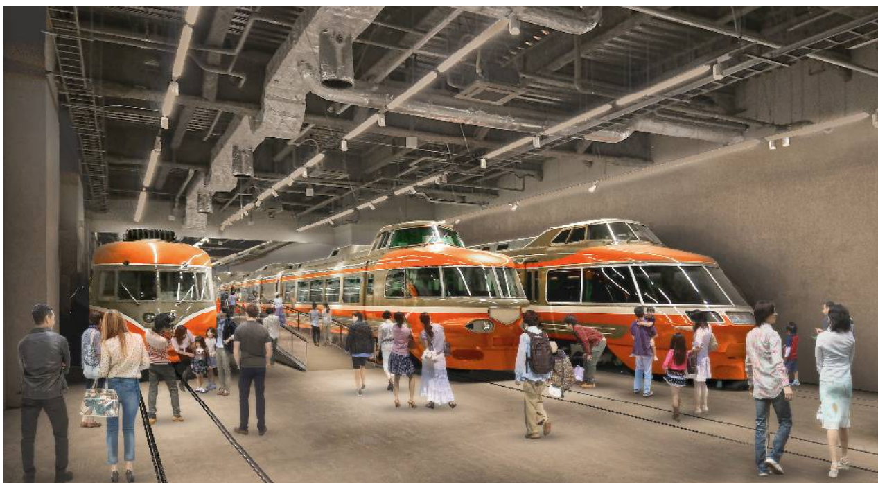
歴代の特急ロマンスカー車両展示（イメージ）

小田急電鉄株式会社（本社：東京都新宿区 社長：星野 晃司）は、小田急線海老名駅隣接地において、2021年春の開業に向けた「ロマンスカーミュージアム」の建設を進めておりますが、この度、4月中旬の開業と「ロゴマーク」「館内の主要コンテンツの概要」を決定しましたので、下記のとおりお知らせします。