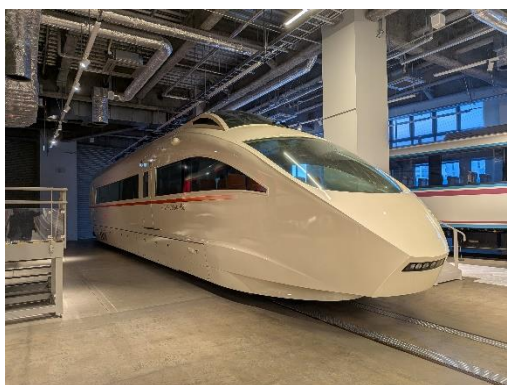
搬入を終え、展示開始の時を待つ VSE

小田急電鉄株式会社が運営するロマンスカーミュージアム（所在地：神奈川県海老名市 館長：吉久 治朗）は、2026 年 3 月 19 日（木）、ロマンスカー・VSE（50000 形）の展示を開始します。また、同日から 2026 年 8 月 24 日（月）まで、これを記念した企画「VSE - 声がつなぐロマンスカーの記憶 -」を実施します。これは、設計や運行に携わった人の「声」や、記録に残らなかった VSE の「記憶」を紹介し、初めて VSE に触れる方にもその魅力を感じていただけるものです。