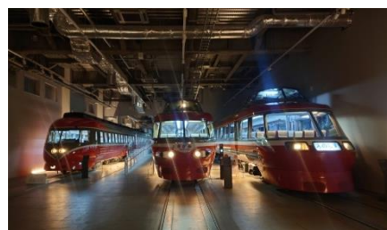
夜モードのロマンスカーギャラリー