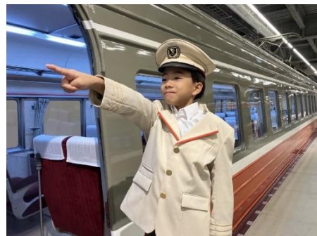
VSE 乗務員体験ツアー (イメージ)