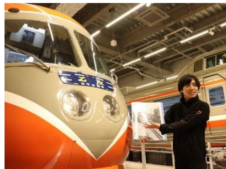
学芸員解説ツアー (イメージ)