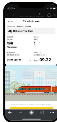
《电子票券使用中的屏幕图像》

URL： https://www.odakyu.jp/sc/passes/digital_tickets/