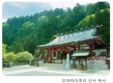
오야마아후리 신사 하사

기원전에 창건된 것으로 알려져 있으며, 산 정상에서는 제사를 지낼 때 사용된 것으로 생각되는 조몬 토기가 출토되고 있다. 오야마 산은 '아에후리야마 (비가 오는 산)'이란 별명이 있는 만큼 예부터 기우 신앙의 중심지로 여겨져 왔다.