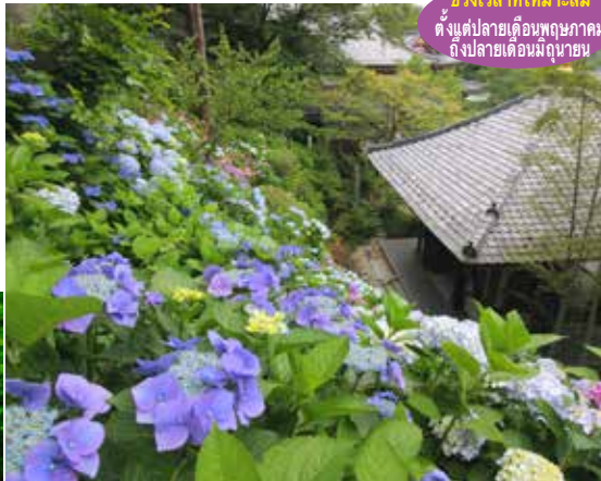
วิธีการเดินทาง เดิน 5 นาที จากสถานี Hase

ช่วงเวลาที่เหมาะสม ตั้งแต่ปลายเดือนพฤษภาคม ถึงปลายเดือนมิถุนายน