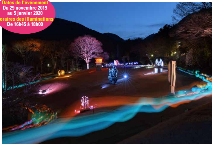
高橋匡太 《Glow with Night Garden Project in Hakone》 Photo: Mito Murakami

Dates de l'événement Du 29 novembre 2019 au 5 janvier 2020 Horaires des illuminations De 16h45 à 18h00