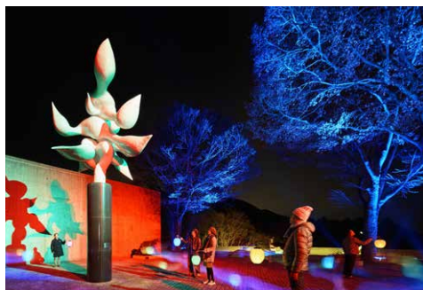
高橋匡太 《Glow with Night Garden Project in Hakone》 岡本太郎 《樹人》