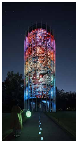
高橋匡太 《Glow with Night Garden Project in Hakone》 ガブリエル・ロアール 《幸せをよぶシンフォニー彫刻》