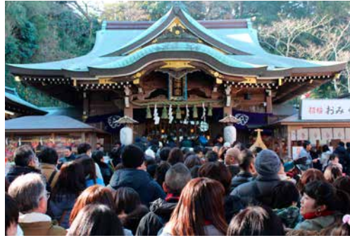
การเดินทาง เดิน 15 นาที จากสถานี Katase-Enoshima

ศาลเจ้านิกายชินโตแห่งนี้ตั้งอยู่ที่ชายฝั่งโชนันบนเกาะเอโนชิมะ ว่ากันว่าเป็นศาลเจ้าที่ช่วยให้คู่รัก สุขสมหวัง ซึ่งที่นี่ประกอบไปด้วย ศาลเจ้า 3 แห่ง เรียกว่า Hetsumiya, Nakatsumiya และ Okutsumiya โดยถูกเชื่อว่าเป็นที่สิงสถิตของเทพแห่งท้องทะเล หลังพระอาทิตย์ตกแสงจากโคมไฟจะสร้างบรรยากาศที่น่าพิศวงให้กับศาลเจ้าอีกด้วย